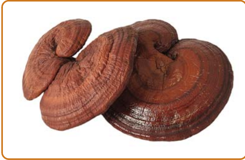
► Abb. 5.13 Reishi. (Anndylan)