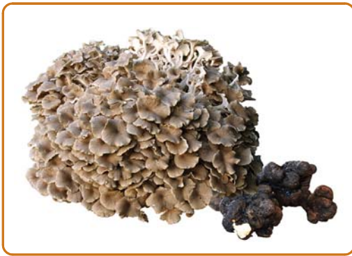
► Abb. 5.12 Polyporus umbellatus. (Dr. László Németh und Gerhard Schuster, Bad Sooden-Allendorf)