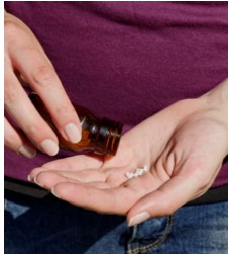
Afb. 1.7b: Het tellen van de globuli.