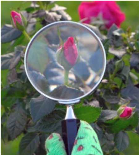
Afb. 1.7a: Het observeren van de aantasting.