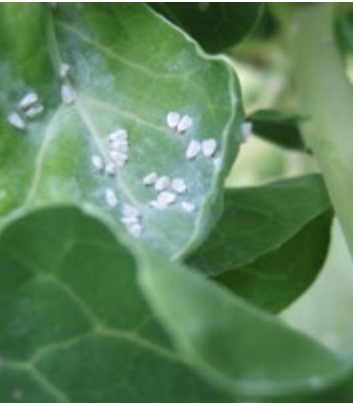
Afb. 2.25: Witte vlieg.