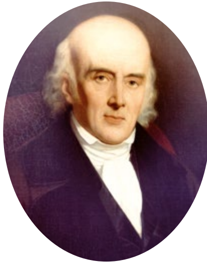
Samuel Hahnemann (1755-1843)

Wanneer het u zal lukken om planten met behulp van homeopathie te laten opknappen, zal u dubbel zoveel plezier aan uw tuin beleven. Zoiets lukt niet van vandaag op morgen (niemand wordt als vakman geboren), maar door te blijven proberen zal het steeds beter gaan en ... het is erg boeiend.