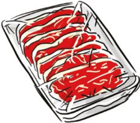
Die Steaks mit Küchenpapier abtupfen.

Für Bulgogi müssen die Steaks richtig dünn geschnitten sein, also dünner als normale Steaks. Sie sollten nur etwa 3 mm dick sein.