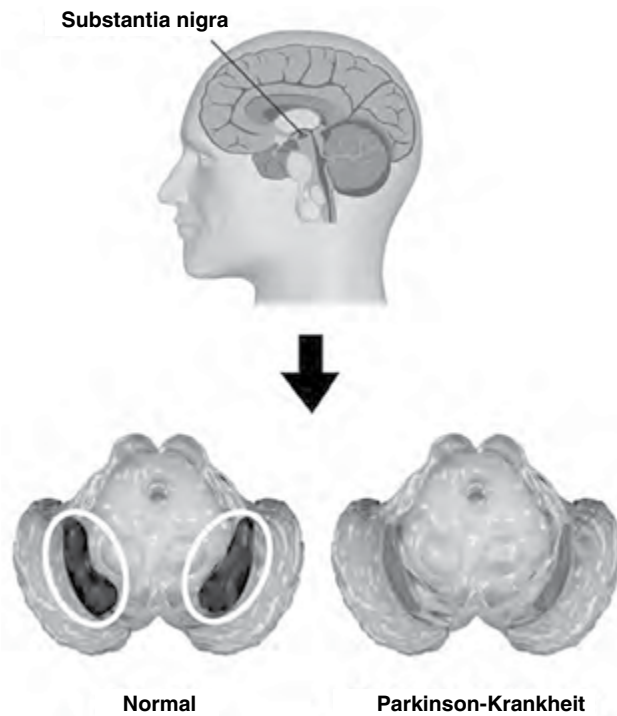
Abbildung 1.3. Die Substantia nigra (lateinisch für „schwarze Substanz“) bei Personen ohne und mit Parkinson-Krankheit. Bei der Parkinson-Krankheit ist die Substantia nigra eine der Schlüsselregionen im Gehirn, in der Zellen absterben.