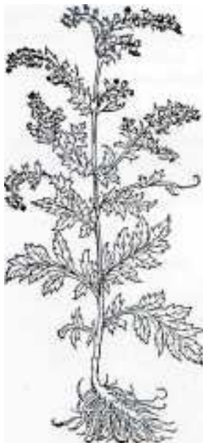
Der Beifuß ( Artemisia vulgaris ) war eine der bedeutendsten Ritualpflanzen der Germanen. Das frische Kraut wurde zum Vertreiben von Krankheitsgeistern in Büscheln über die Befallenen gestrichen und anschließend verbrannt. Beifußkraut ist einer der ältesten in Europa benutzten Räucherstoffe. Der Beifuß gilt auch als ein Johanniskraut. (Holzschnitt aus HIERONYMUS BOCK, Kreutterbuch , 1577)

Im Mai, wenn alles blüht und sprießt, kam der strahlende Sonnengott vom Himmel, seine schöne Braut, die Blumengöttin, zu freien. Unter großem Jubel zog sie ihm vom Wald oder dem nahe liegenden heiligen Berg - später aus dem Heiligen Hain oder aus einem höhlenartigen Tempel - entgegen. Im Maibaum - meist eine geschälte Birke - und einem mit bemalten Eiern, roten, in Opferblut getauchten Bändern und anderen Votivgaben geschmückten Blumenkranz nahm das göttliche Paar unmittelbare Gestalt an. Manchmal auch verkörperten sich die Götter in der geschmückten Maibraut und dem Maikönig, der schönsten der Jungfrauen und dem stärksten Jüngling im Dorf. Sie wurden meist mit Raserei und wilden Orgien empfangen. Wie konnte es auch anders sein, denn die unmittelbare Gegenwart des Göttlichen raubt den Menschen den Verstand! Noch lange feierten die Erben der jungsteinzeitlichen und bronzezeitlichen Bauern die mit blühendem Weißdorn geschmückte Maikönigin.