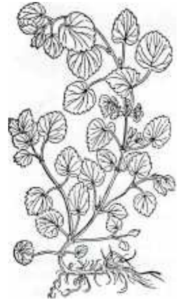
Der Gundermann oder die Gundelrebe ( Glechoma hederacea L., Nepeta hederacea [L.] TREV.) ist eine gut eßbare Wildpflanze (besonders für Frühlingsalate und die Gründonnerstagsuppe). Dieses germanische Zaunkraut wurde zu Kränzen gebunden, durch die man am Walpurgistag (1. Mai) Hexen erschauen und erkennen kann. Die Gundelrebe sollte auch die Kraft haben, die Milch vor Behexung zu schützen oder von Zauberflüchen zu befreien. Zum Fruchtbarkeitszauber nähten die Aargauer Frauen Gundelreben in die Säume ihrer Röcke. Volksmedizinisch wurde das Kraut zur Anregung des Milchflusses, zur Wundbehandlung, zum Vertreiben der »Zahnwürmer« und als Abführmittel gebraucht. (Holzschnitt aus HIERONYMUS BOCK, Kreutterbuch , 1577)

Was sind das für Visionen? Es sind Bilder von der Innenseite der Natur. Ist es das Bilsenkrautbier, das in unmäßigen Mengen getrunken wurde? War es das nimmer endende Tanzen, die vielen Stunden ohne Schlaf, die dafür verantwortlich sind? Oder gar halluzinogene Pilze, etwa Glockendüngerlinge, Heudüngerlinge, Täuschlinge und andere Narrenschwämme, die die Menschen entrückten? Schließlich galt im Mittelalter der Tag des Sankt Veit (15. Juni) als Anfang des Mittsommers - »hier mag die Sunn nit höher!« Sankt Veit ist der »Schwammerlpatron«. Die Slaven sagen, ihm stehen gute Kobolde zur Seite, die die Pilze gut wachsen lassen. Sankt Veit wurde auch angerufen bei der Fallsucht und ebenso bei der Tanzwut, die im Mittelalter immer