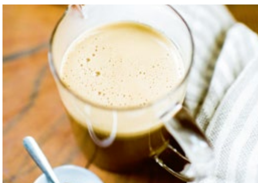
Zichorien-»Kaffee« // S. 94