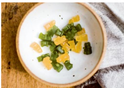
Leuchtend grüne Gummibärchen & Grapefruit- Gummibärchen // S. 82