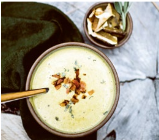
Cremige Pilzsuppe mit Speck und Salbei // S. 145