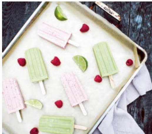
Kollagen-Beeren Eis am Stiel & Avocado-Ananas Eis am Stiel // S. 303