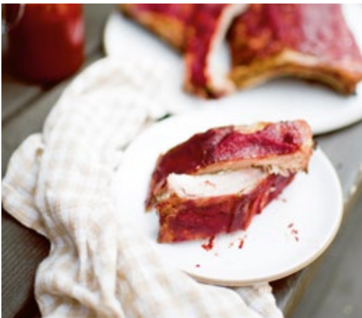
Spareribs aus dem Ofen mit BBQ-Soße // S. 249