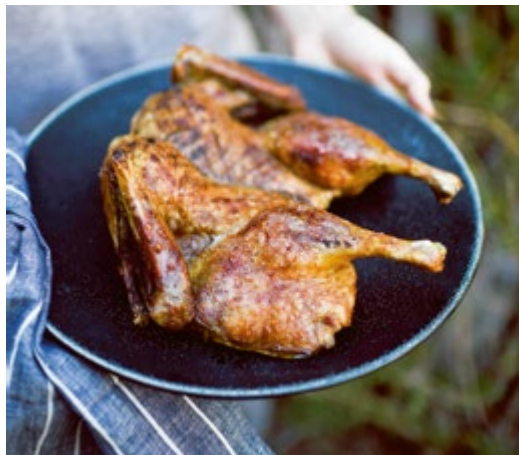
Langsam geschmorte Ente // S. 199