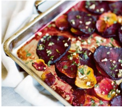
Rote Bete aus dem Ofen mit Estragon // S. 170