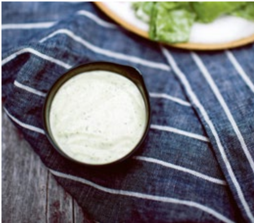
Joghurt-Dressing // S. 130