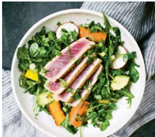
Gelbflossen-Thun-Salat mit Koriander- Limetten-Dressing // S. 268