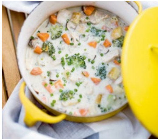
Cremige Hühnersuppe mit Brokkoli und Wurzelgemüse // S. 188