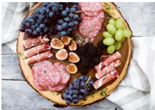
Frühlingsanfang-Vorspeisenplatte // S. 69