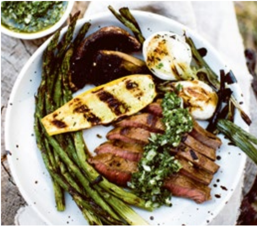
Mariniertes Steak mit Gemüse // S. 208