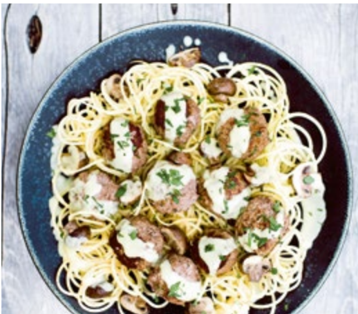
Steckrübenudeln mit Klößchen in herzhafter »Sahnesoße« // S. 224