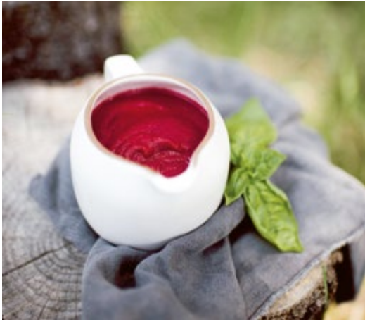
Tomatenlose Soße // S. 118