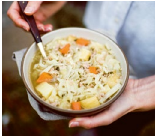
Kohlsuppe // S. 257