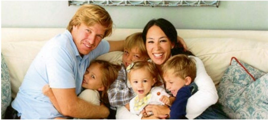
FAMILIENFOTO IM »SHOTGUN«-HAUS.