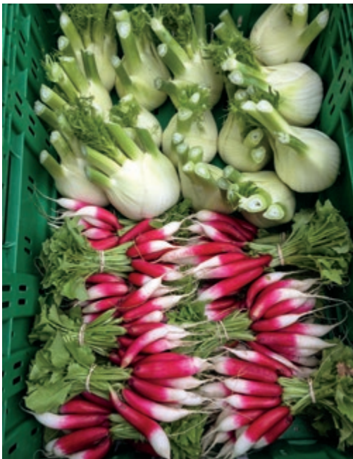
Kontrastreiche Farben sorgen für eine tolle Präsentation auf dem Markt.

Um erfolgreich im Geschäft mit Restaurants zu sein, muss der Gärtner umtriebig und zuverlässig sein. Umtriebig, um potenzielle Restaurants als Kunden zu finden und sie zu überzeugen, bei ihm zu kaufen; umtriebig auch, um neue Kulturen, Saisonverlängerungen und