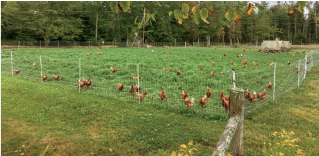
Unsere Legehennen auf der Weide

Produktivität und die gute Bodenkrume neuer Böden zurückzugeben. Gras ist ein Bodenbildner, ein Bodenerneuerer und ein Bodenschützer.“ Weaver war sich sehr bewusst, dass die Pflanzen, die die Bodenfruchtbarkeit erhalten werden, um die Menschheit bis in die ferne Zukunft zu ernähren, bekannte Arten sind; es sind jedoch für uns keine Nahrungspflanzen. Vielmehr sind es die mehrjährigen Gräser, Leguminosen und zahlreiche tiefwurzelnende essbare Kräuter, die auf Weiden wachsen und wechselnd mit Vieh beweidet werden. Sie sind der Schlüssel zur Erhaltung der Bodenfruchtbarkeit und zur Verhinderung