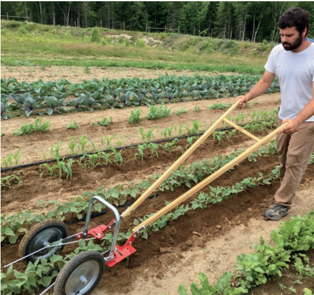
Doppelradhacke mit U-förmigem Bügel und Blattheber (Johnny's Selected Seeds)

derartige Hindernisse auf den Feldern wohl ein größeres Problem darstellen als die Auswahl einer Radhacke. Die Wahrheit ist, dass die Konstruktion der Radhacke mit großem Durchmesser mangelhaft ist. Die menschliche Kraft ist begrenzt und sollte nicht vergeudet werden. Bei einem gut konstruierten Werkzeug wird die vom Bediener ausgeübte Kraft direkt auf den bearbeitenden Teil des Geräts übertragen. Bei einer Radhacke ist dieses Arbeitsteil das bodenbearbeitende