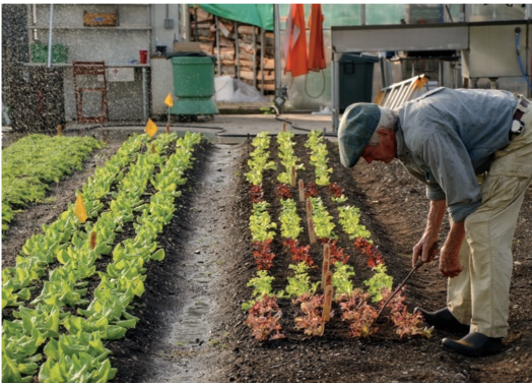
Holz als Heizquelle im Winter lässt hochwertige Wintersalate wachsen.

E s gibt keine einfachen Lösungen oder Abkürzungen bei dieser Arbeit. Es gibt keine Allheilmittel. Es gibt jedoch logische Antworten. Durchführbare Produktionstechniken können den ökologischen und ökonomischen Realitäten Rechnung tragen. Einige dieser Produktionstechniken können neue Denkweisen erfordern, während andere scheinbar altmodische oder überholte Ideen wieder beleben. Bei näherer Betrachtung