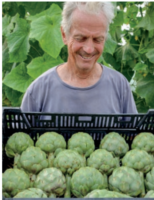
Artischocken aus Maine. Da wird Kalifornien grün vor Neid!