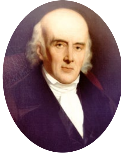
Samuel Hahnemann (1755–1843)

Ich bin zwar Homöopathin, doch keine Gärtnerin – deswegen eine Aufmunterung für alle zukünftigen „homöopathischen Gärtner(innen)“. Ich besitze einen Hausgarten und bin von Beruf weder Gärtnerin noch Botanikerin. Und vor 40 Jahren konnte ich kaum eine junge Kohlrabipflanze von einer Rose unterscheiden. Sie sehen, es ist noch kein „Meister vom Himmel ge-