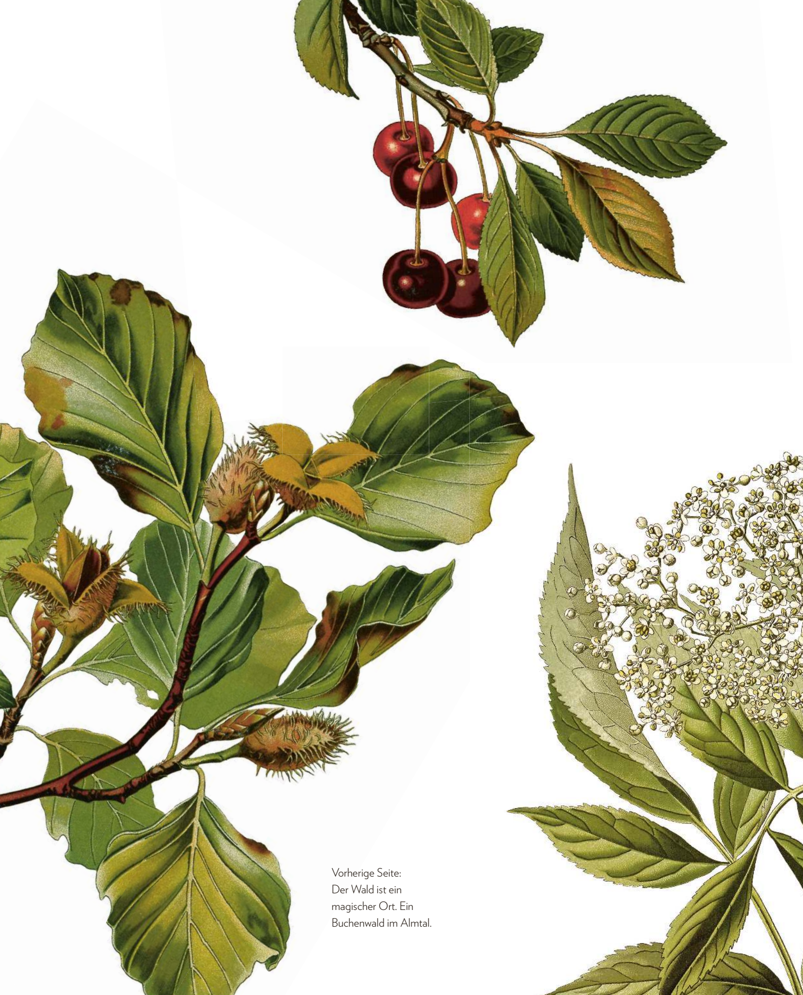
Vorherige Seite: Der Wald ist ein magischer Ort. Ein Buchenwald im Almtal.