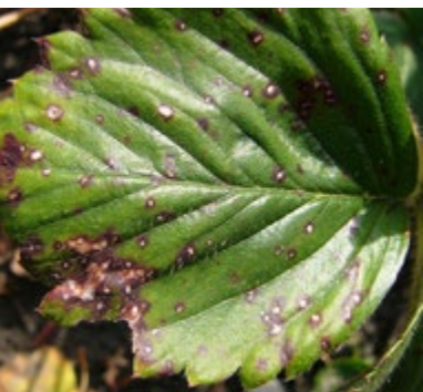
Abb. 3.22: Liegt ein Befall mit dem Erreger der Weißfleckenkrankheit vor, so zeigen die Flecken ein weißes Zentrum, das bei Befall mit der Rotfleckenkrankheit fehlt.