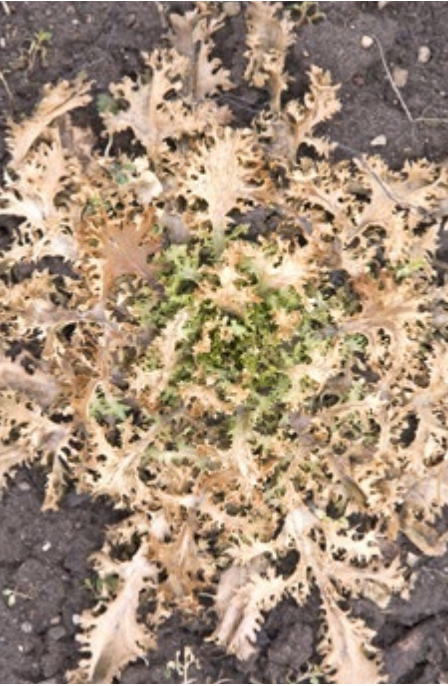
Abb. 4.28: Vernachlässigter Frisée-Salat.