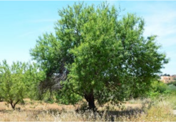
Abb. 6.38: Alter, deutlich verjüngter Mandelbaum, 1 Jahr nach der homöopathischen Behandlung, Mai 2015.