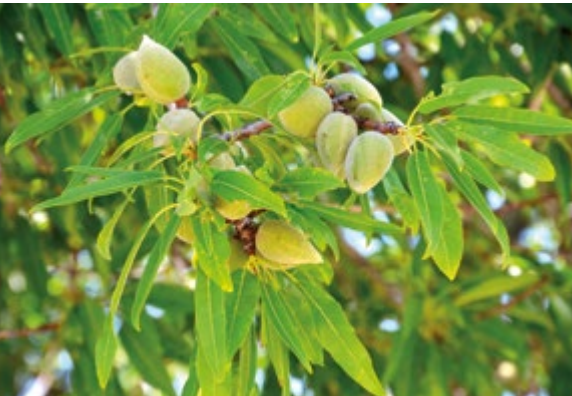
Abb. 6.39: Große, in Büscheln wachsende Mandeln, Mai 2015.