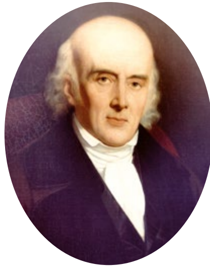
Samuel Hahnemann (1755–1843)

Ich bin zwar Homöopathin, doch keine Gärtnerin – deswegen eine Aufmunterung für alle zukünftigen „homöopathischen Gärtner(innen)“. Ich besitze einen Hausgarten und bin von Beruf weder Gärtnerin noch Botanikerin. Und vor 40 Jahren konnte ich kaum eine junge Kohlrabipflanze von einer Rose unterscheiden. Sie sehen, es ist noch kein „Meister vom Himmel ge-