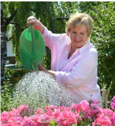
Abb. 1.7f: Gießen von Blatt- und Wurzelbereich.