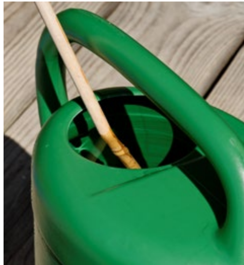
Abb. 1.7e: Gießwasser kräftig durchrühren.