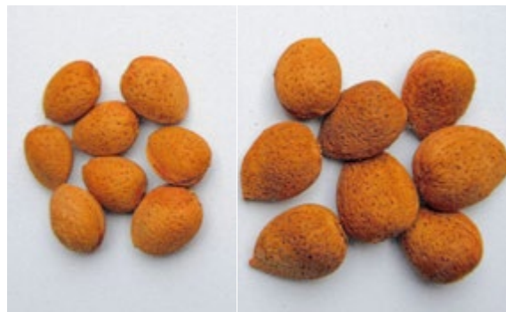
Abb. 6.40: Links: Mandelkerne eines unbehandelten Baumes. Rechts: Ernte eines behandelten Baumes.

Der Größenunterschied zwischen den unbehandelten und den homöopathisch behandelten Mandeln ist offensichtlich (→ Abb. 6.40).