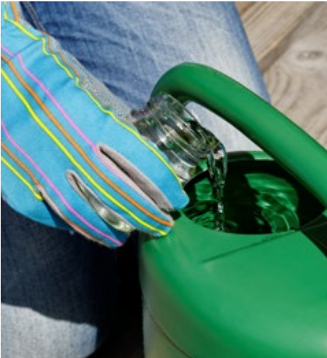
Abb. 1.7d: Aufgelöste Globuli werden ins Gießwasser gegeben.

oder Plastiklöffel verrühren. Dann mit der zweiten Hälfte ebenso verfahren.