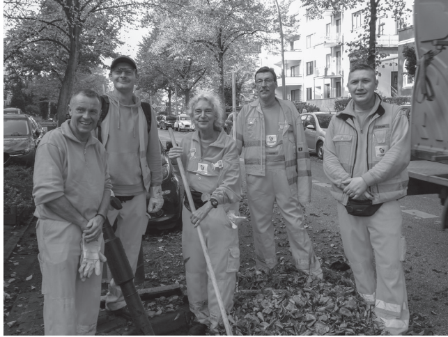
Die Autorin als mithelfender Gast beim Straßenreinigungs-Team