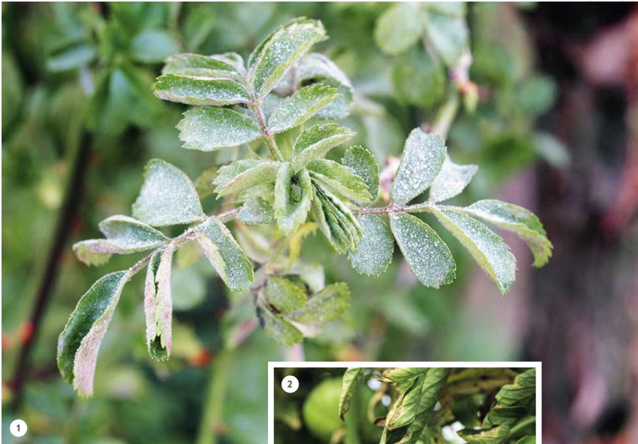
Pilzkrankheiten haben viele Gesichter: Echter Mehltau (1) , Kraut- und Braunfäule (2) , Kräuselkrankheit (3) , Monilia-Fruchtfäule (4) .